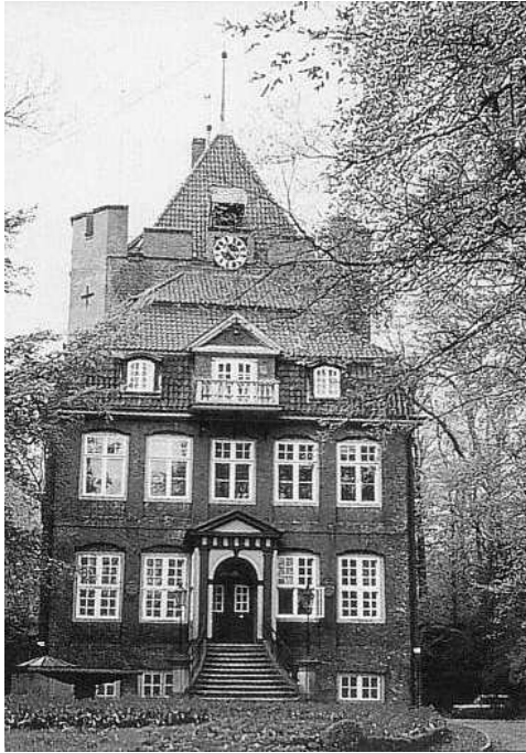
Schloß Ritzebüttel heute (früher Herrensitz der Lappes und Zentrum des historischen Amtes).

gemütlicher Atmosphäre für das leibliche Wohlbefinden unserer Gäste mit lukullischen Leckerbissen bestens gesorgt.