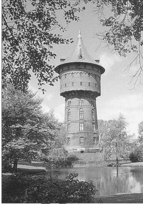
Heimliches Wahrzeichen der Stadt Cuxhaven: Der 1897 errichtete Wasserturm

unsere geschichtliche Betrachtung nicht so wichtig sind.