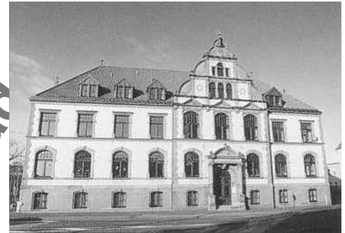
Zu den stattlichen Bauwerken in der Deichstraße gehört das 1904 eingeweihte Amtsgericht.

Der südliche Abschnitt der Deichstraße zwischen Mittelstraße und Kaemmererplatz wurde erst im letzten Drittel des 19. Jahrhunderts angelegt (ab 1870); dagegen gehört der nördliche Teil,