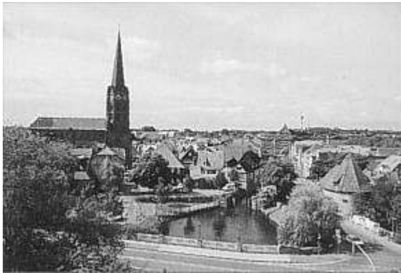
Ansicht der Stadt von Norden

9. Die Lange Straße geleitet Sie zur St. Petri-Kirche; ursprünglich endete sie auf dem St. Petri-Platz, der auch Schweinemarkt hieß. Die St. Petri-Kirche ist die Hauptkirche der Stadt Buxtehude und mit dem 75m hohen Turm das weithin sichtbare Wahrzeichen der Stadt