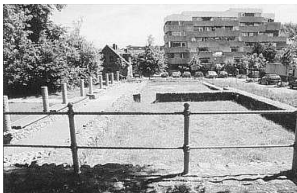
Altes Kloster, rekonstruierte Grundmauern des Südflügels und des südlichen Kreuzgangs.

dieser Stelle gründeten die Adligen Heinrich und Gerlach von Buxtehude sowie Floria, die Gattin Heinrichs, das Benediktiner-Nonnenkloster Buxtehude, das bedeutendste Frauenkloster an der Niederelbe. Grundmauern des Klosters, das nach der Säkularisation durch die Schweden 1648 verfiel, wurden nach archäologischen Befunden rekonstruiert und tragen zu einer reizvollen Platzgestaltung bei.