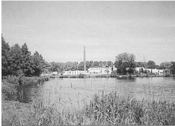
Estedamm und Mühlenteich.

Sie war aus einer im Jahre 1622 gegründeten Papiermühle hervorgegangen und entwickelte sich im 19. Jahrhundert zu einer der größten deutschen Papierfabriken mit zeitweise über 300 Beschäftigten. 1925 mußte sie jedoch Konkurs anmelden und den Betrieb einstellen.