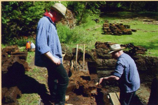
Torfstechen wie früher

Und trotzdem kamen sie freiwillig - für ein eigenes Stück Land. Erleben Sie den Alltag der ersten Siedler im Moor!