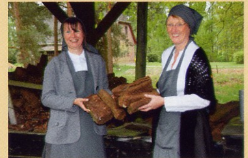
Führungen in historischer Arbeitskleidung

Das ist noch nicht alles! Auch unsere Umgebung lädt zum Entdecken ein, z.B.: